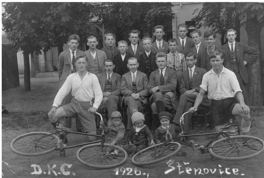
Dělnický cyklistický klub 1926

O d dob slavného Tyrše se v Čechách tělocvičilo organizovaně. To už tak bývá. Chce-li se dosáhnout celospolečenského cíle, musí se založit spolek. I stalo se, že podle Tyrše začali Češi „tužit“ nejen svaly, ale zároveň i vlasteneckého ducha ve spolku, který nese jméno Sokol do dnešních dnů. Řeka času, kterou nelze zastavit, ovšem přinášela a stále přináší společenské změny, události a vůbec veškeré aktivity lidí i do činnosti tělocvičných sdružení. Za pár desítek let po založení Tělocvičné jednoty Sokol se ustavila v Čechách další tělocvičná organizace, kterou byla Dělnická tělocvičná jednota. Sokol i DTJ měly shodné cíle vlastenecké, ale rozcházely se v sociálním směřování.