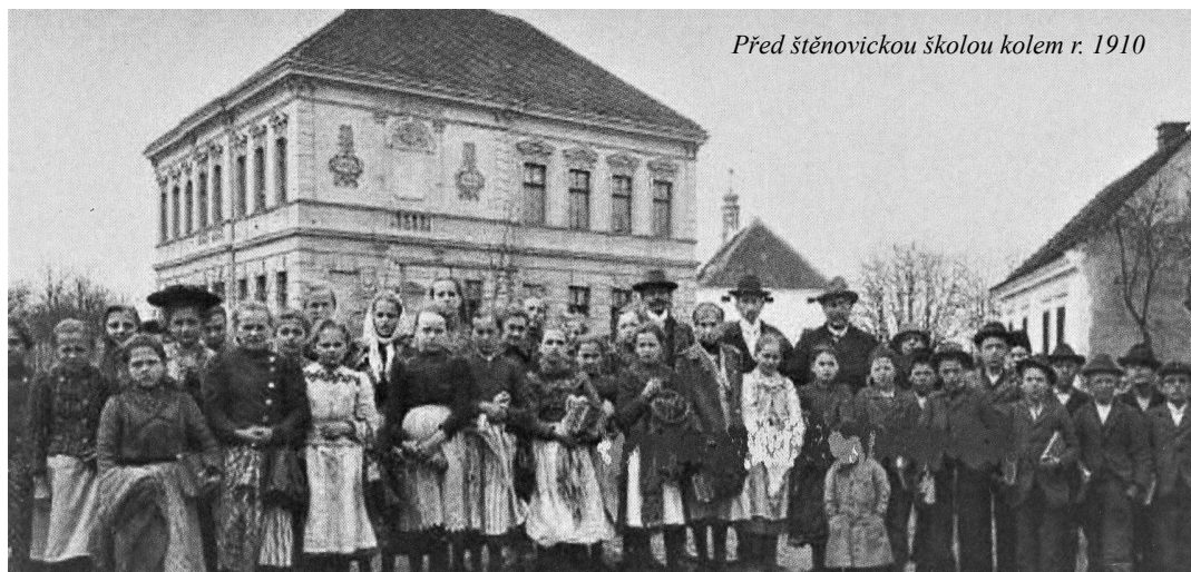
Před štěnovickou školou kolem r. 1910

kých dětí do Litic nebyla zrovna ideální. Jednak byla škola příliš daleko, jednak musely děti častěji zůstat doma, k tomu se přidávala i nepřízeň počasí zvláště v zimních měsících. Velká absence dětí ve výuce vedla úřady nakonec k rozhodnutí, aby byla zřízena škola ve Štěnovicích. Nahrál tomu i fakt, že v roce 1783 byl zrušen klášter trinitářů při kostele sv. Prokopa a bylo tudíž možno využit