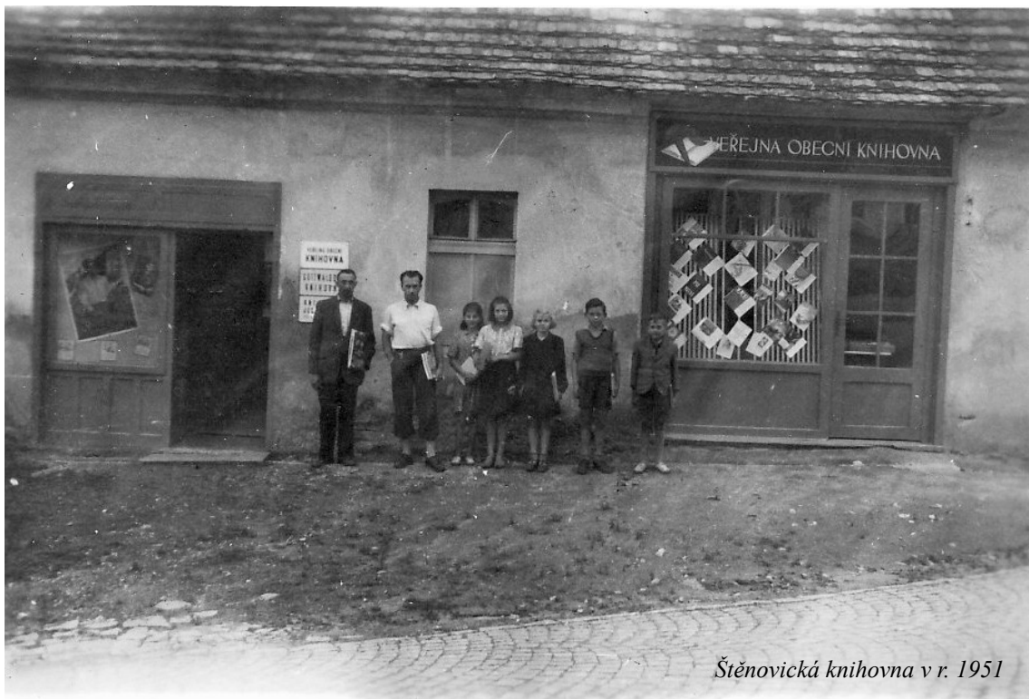
Štěnovická knihovna v r. 1951

národa českého. To, že si kameníci knih velmi vážili, dokládá zápis z roku 1906: „Usneseno darovat vlastní skupinové knihy Vzdělávacímu spolku Máj. Zde jsou za členy pomocní dělníci ze závodů kamenických a je třeba, by se četbou vzdělávali.“ Proto, když byl přijat zákon o zřizování obecní knihovny, rozhodli se kameníci převést knihovnu Skupiny do místní veřejné knihovny. Kromě knih byly ve veřejné knihovně čtenářům dostupné i časopisy. Štěnovická obecní knihovna měla stále svůj prostor na