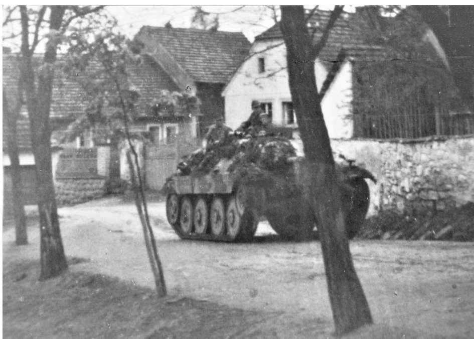
německý tank 5. května na silnici od Losiné

Pro Štěnovice byl nejslavnějším dnem 5. květen 1945. Německo kapitulovalo a konec války byl potvrzen. Všeobecná radost byla převeliká. Nebylo snad chalupy, kde by se neobjevila státní vlajka Československa, děvčata oblékla národní kroje, v hospodě, především v Lidáku, nebraly konce překotné hovory, připíjelo se na nové dny. Vzápětí začal úklid po „národních hostech“ ve škole, aby se konečně začalo s řádným vyučováním. Mládež a školní děti uklízely kolem pomníku před školou. Kdekdo chtěl alespoň troškou přispět k tomu, aby ves přivítala mír. Ale to, že ještě před pár dny „byla válka“, se pochopitelně stále připomínalo překotnými