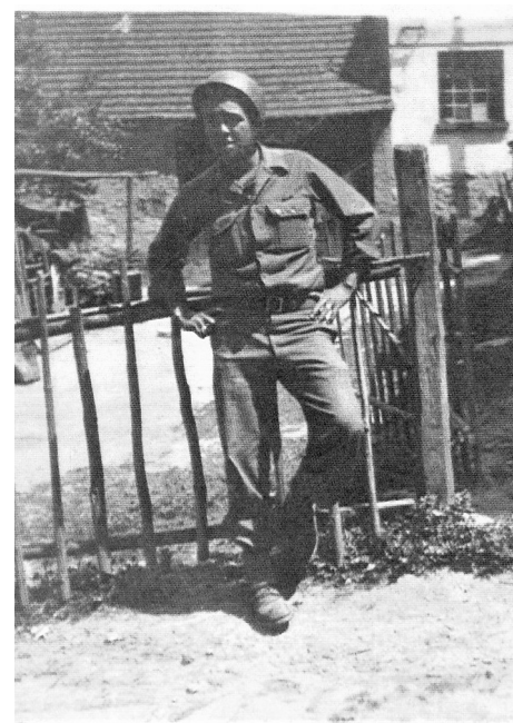
americký voják ve vsi