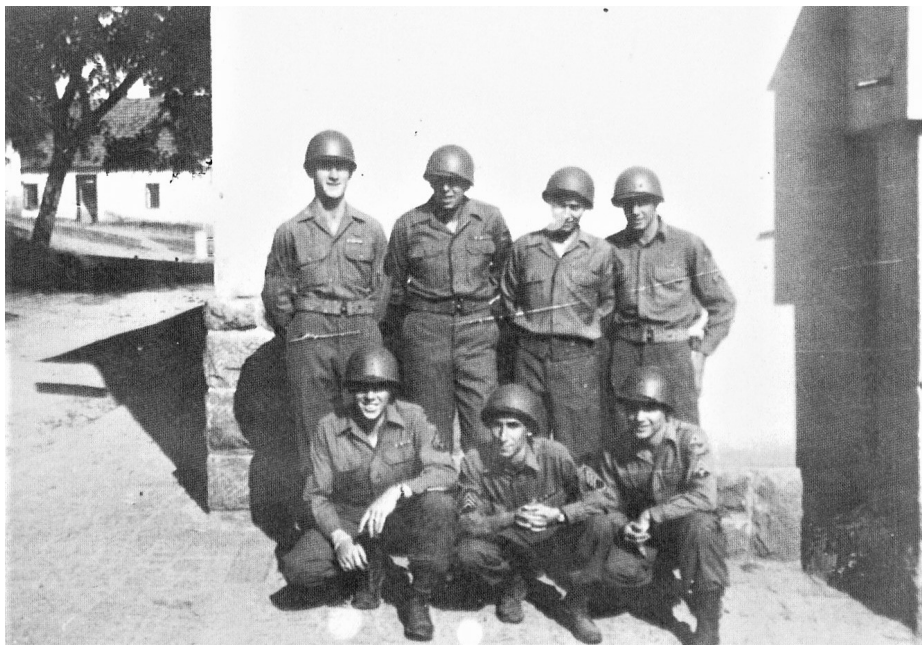
američtí vojáci před Lidovým domem