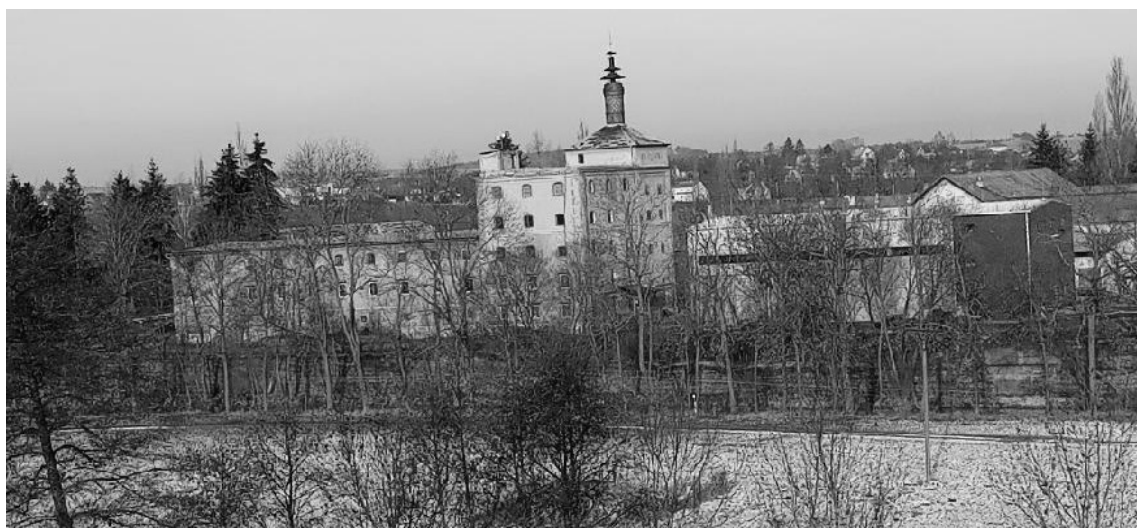
Současnost: Vlevo sladovna - poslední zbytky z historických budov pivovaru. Vpravo nevzhledná plechová „krabice“ na místě bývalé historické varny.