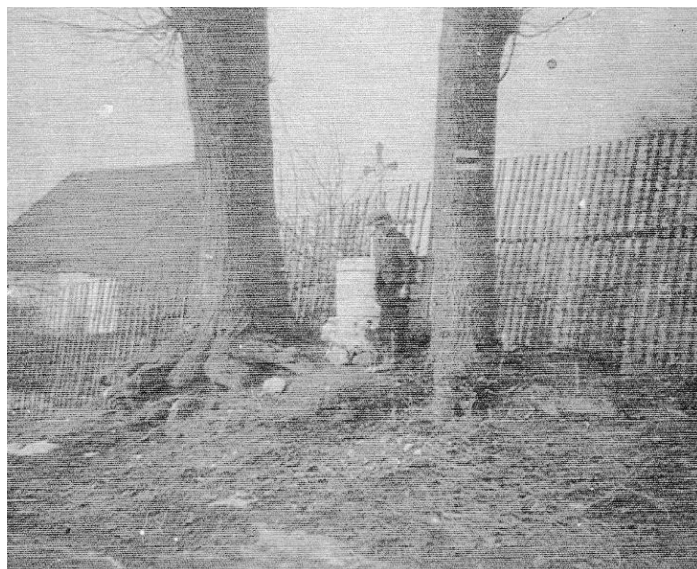
Památník na místě bývalé štěnovické tvrze, 30. léta 20. století.