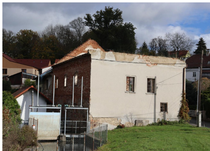
štěnovický mlýn dnes